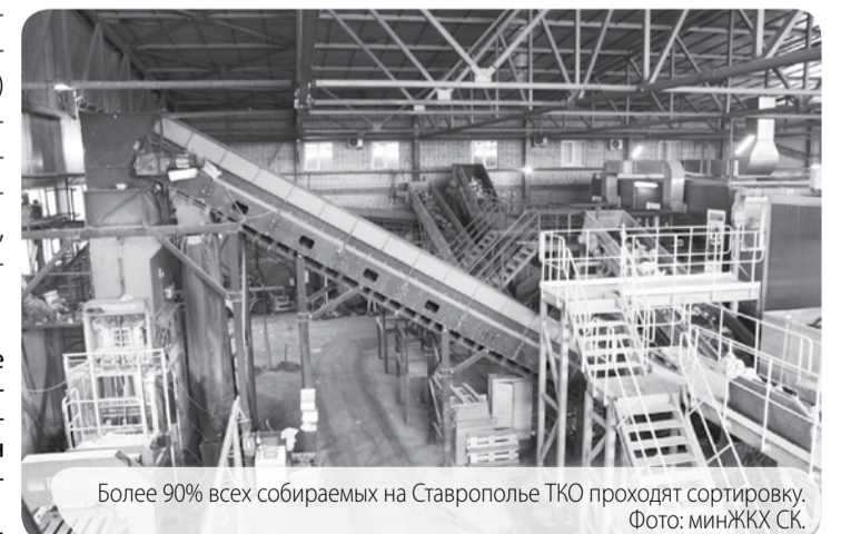
Более 90% всех собираемых на Ставрополье ТКО проходят сортировку.

Отметим, что за последние пять лет Ставрополье значительно нарастило объёмы по обработке твёрдых коммунальных отходов. До 2018 года, когда регион в