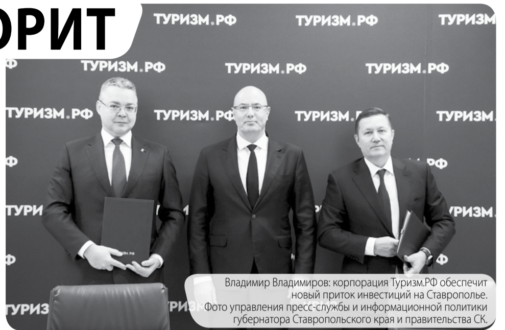
Владимир Владимиров: корпорация Туризм.РФ обеспечит новый приток инвестиций на Ставрополье.

– сказал губернатор. Генеральный директор корпорации Сергей Суханов отметил, что в перспективе планируется создание в крае международного медицинского